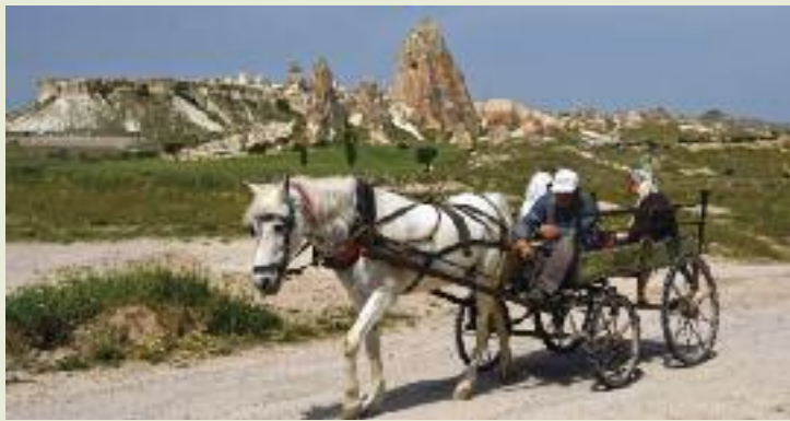
La Cappadoce