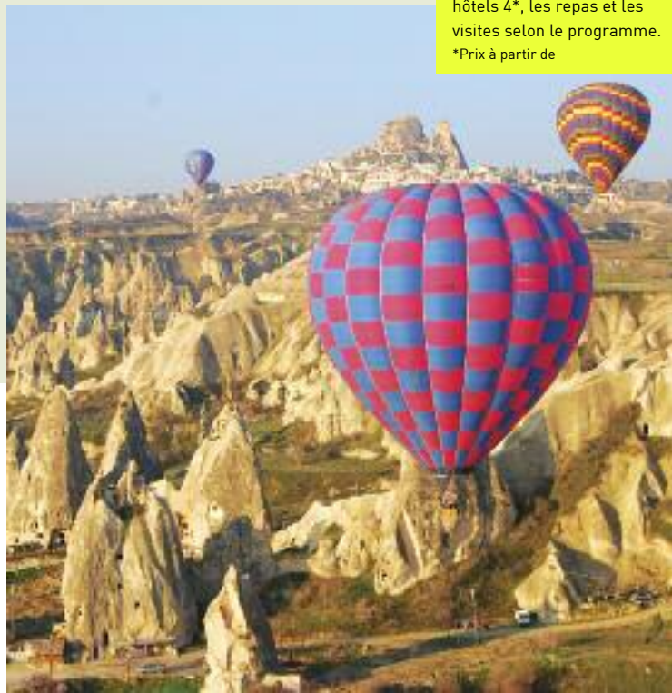
La Cappadoce

Les vols, les transferts, le logement dans les hôtels 4*, les repas et les visites selon le programme. *Prix à partir de