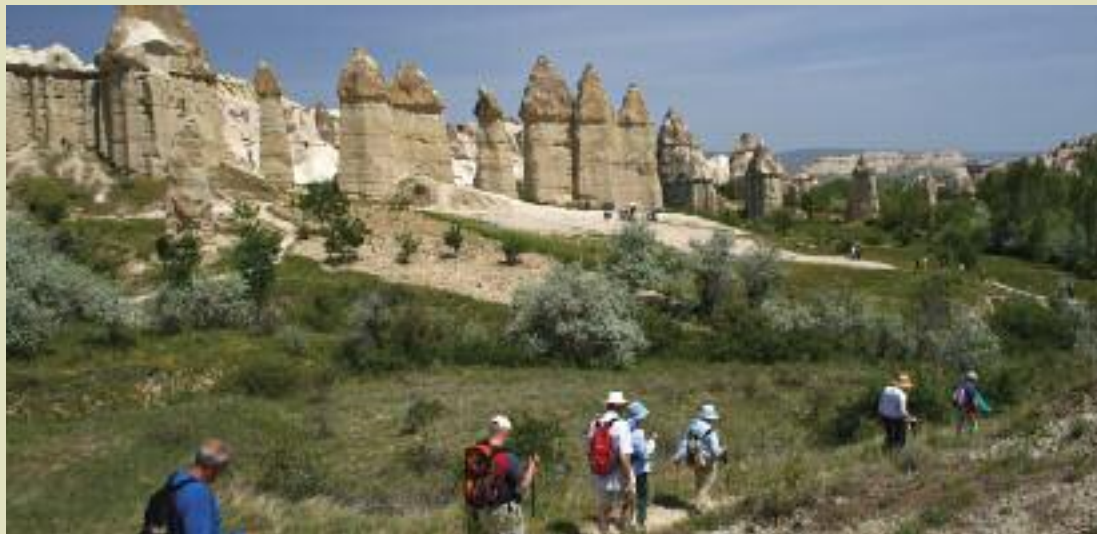
La Cappadoce