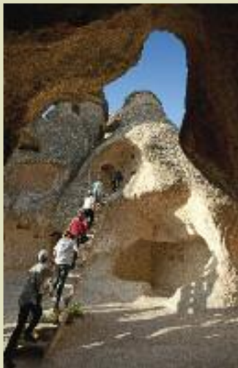
La Cappadoce