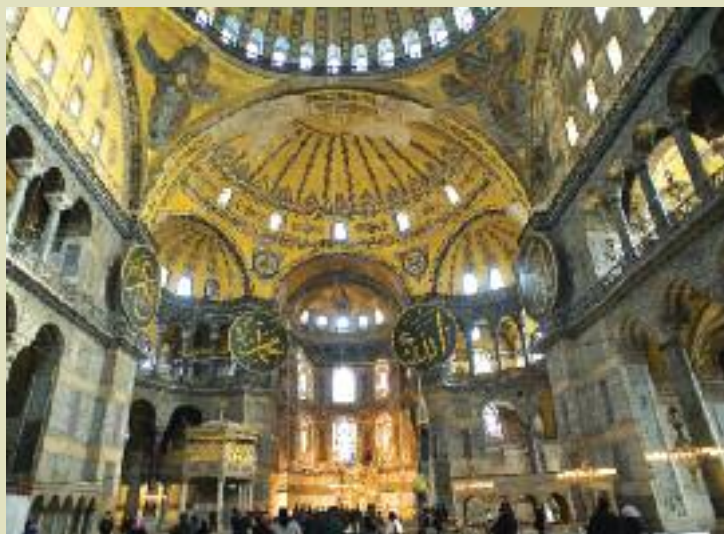
Sainte Sophie, Istanbul

Les vols, les transferts, le logement dans les hôtels 4*, les repas et les visites selon le programme. *Prix à partir de